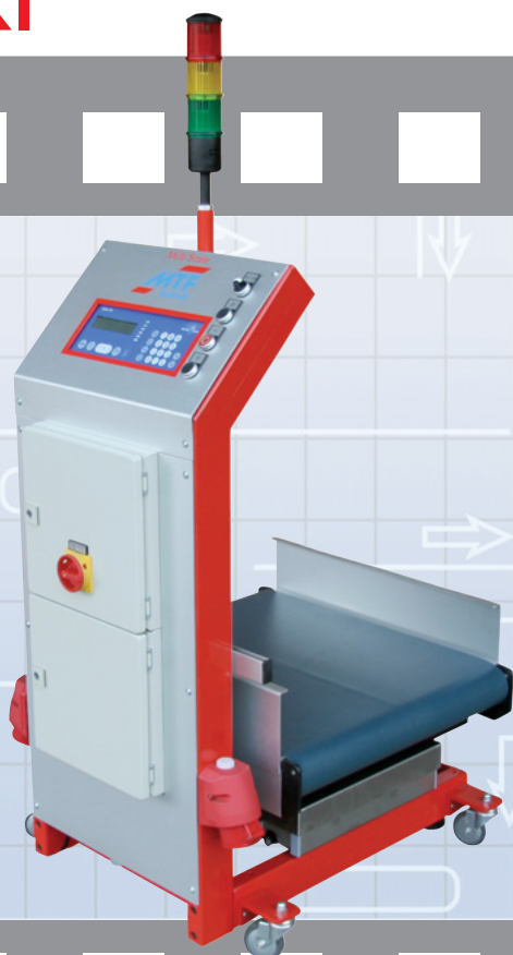
MTF Multi-Scale WT 0-60/20