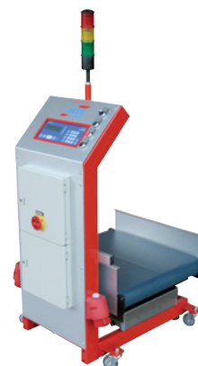
MTF Multi-Scale WT 0-60/20