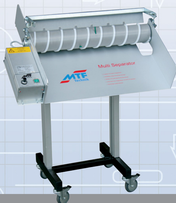
MTF Multi-Separator MS-600