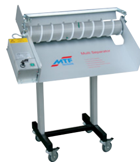
MTF Multi-Separator MS-600